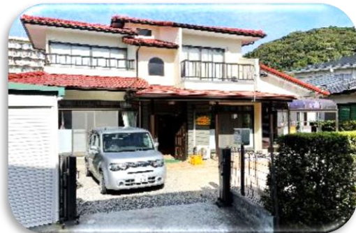
「て・い・く」上高橋 (放課後等デイサービス)

H29年にスタートして6年目を迎えた障害児通所支援事業所「子ども育ちの家 て・い・く」は、熊本市手をつなぐ育成会で一番新しい事業所です。