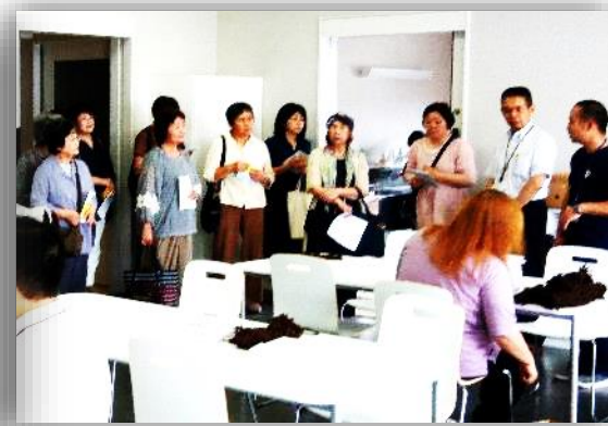
施設見学 はなぞの学苑