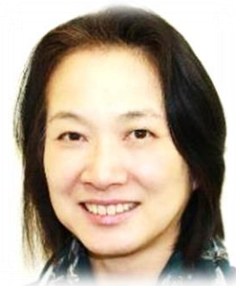
熊本市手をつなぐ 育成会会長

現在も、本人・保護者を中心に関係の皆さん、事業所職員が共に手をつなぎ、障がい福祉の充実と共生社会の実現に努めています。