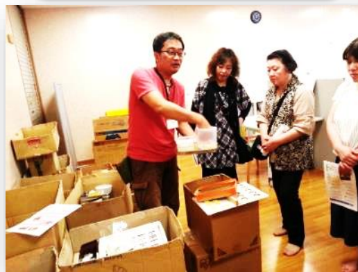
施設見学 ケアはぴねす