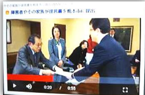
熊本市長への地震の 提言書提出

熊本市のほか、国や県の施策に対する要望書も全国や県の育成会を通して提出、さらに、行政主催の様々な委員会に委員として出席し、声を伝える