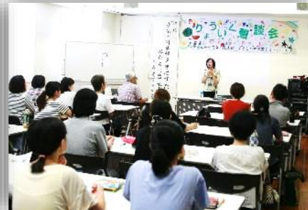
療育懇談会の開催 8