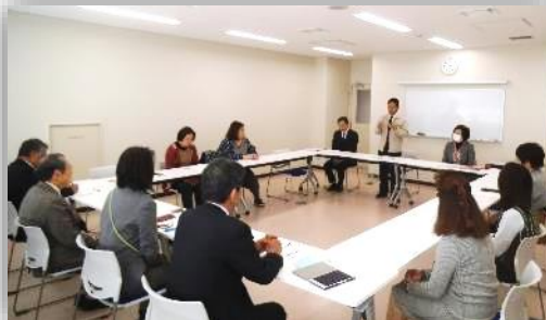
熊本市障がい保健 福祉課との意見交換会

市の障がい保健福祉課と教育委員会との意見交換会を毎年開催。福祉や教育の充実に向け意見交換を行う