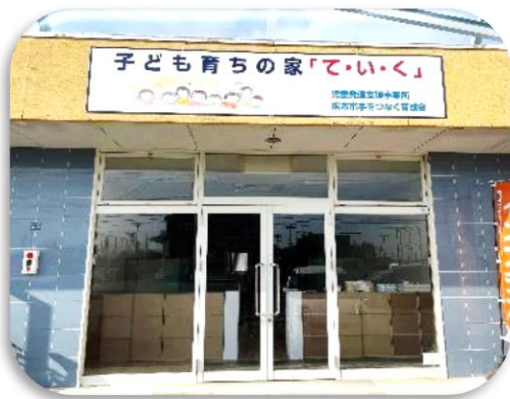
「て・い・く」下代 (児童発達支援)