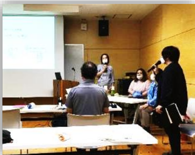
疑似体験の出前講座 「くまぐま隊」

障がいのある人への様々な理解啓発活動や諸課題をテーマに勉強会、フォーラムなどを開催