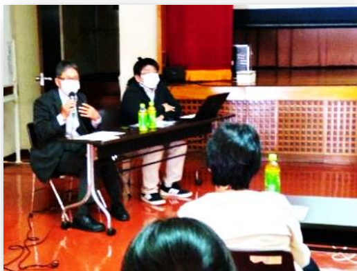
「先輩教えて」拡大版の開催