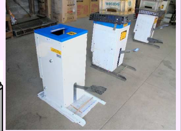
手前が、新しい缶つぶし機