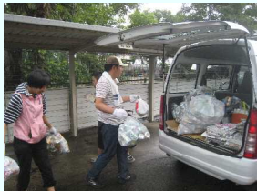
アルミ缶・紙の回収