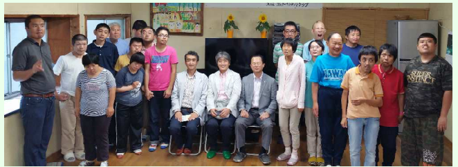
6/24 船橋ライオンズクラブの方との記念撮影

ちょうど、24日(金)のミニコンサートの時間に、会員の方3人が福岡での世界大会に参加されるついでに作業所にお出でになりました。利用者・職員で、テレビと時計のお礼を直接申し上げることができてとてもよかったと思っています。