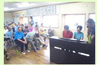
楽しい交流のひととき