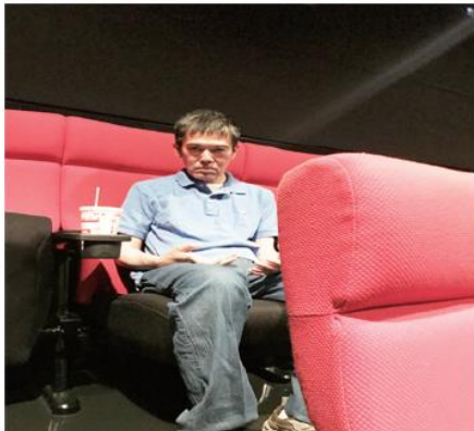
4. いざ、鑑賞！！ 鑑賞時は落ち着いて映画の世界へ入っていきましょう