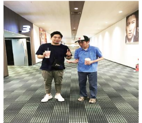
3. いざ、スクリーンへ 何を観るかも大切ですが、誰と観るかも大事ですよwww