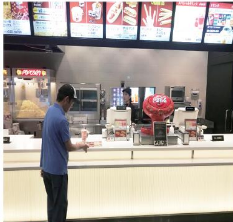
2. 飲み物購入 必ず買う必要はないですが、今回はジュースを