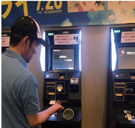
1. チケット購入 機械で購入ですが、とても簡単です