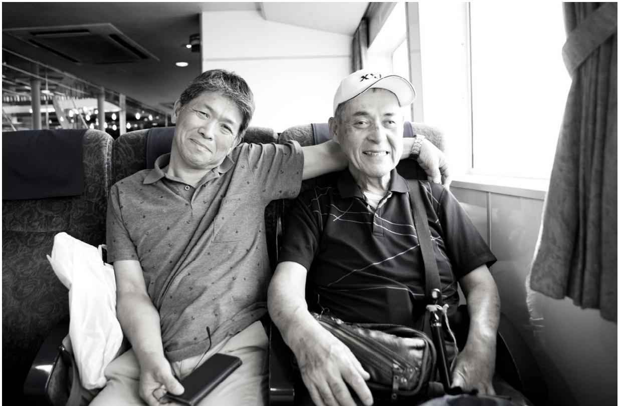
帰りのオーシャンアローで ※モノクロの画像もなかなかいいですね。