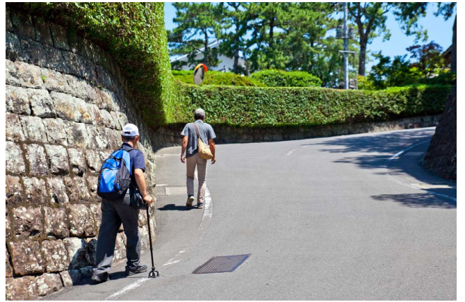
島原城に続く坂道