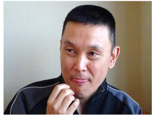
ご飯、待ちどーしいなあ。