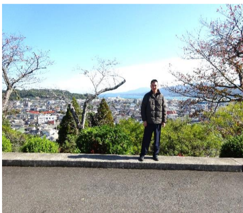
天草キリシタン館にて