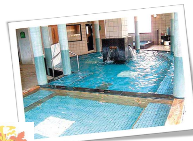
最後は温泉、城の湯。 久しぶり～!