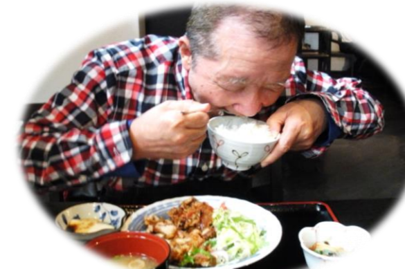
あい変わらず おうせいな食べっぷり!