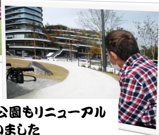
幸島公園もリニューアル してました