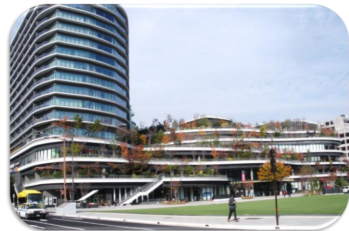
紅葉を迎えたサクラマチクマモト 街も色づいていました