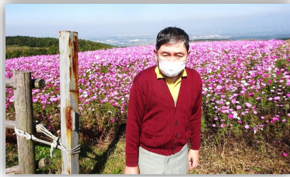
満開のコスモス畑