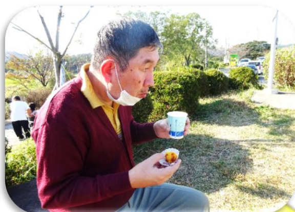
スイートポテトとしもネードでおやつ休憩