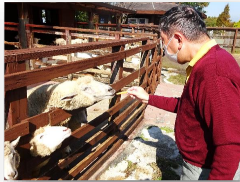
動物のえさやり体験