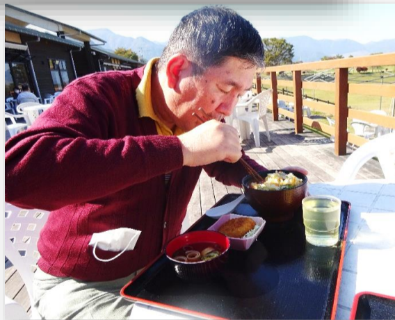
お昼は、かしーうどん、野菜のかき揚げ、里芋のコロッケ