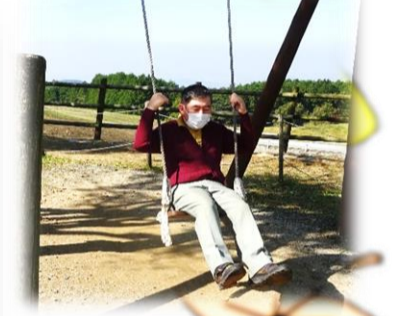
ハイジのブランコ