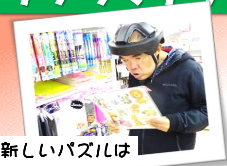
新しいパズルはこれにしよう!