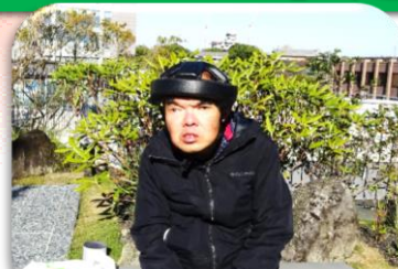
サクラマチクマモトの 屋上庭園で休憩