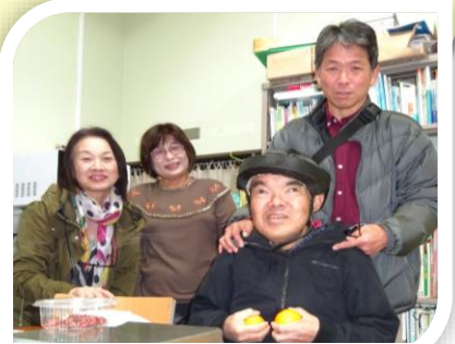
事務局にごあいさつ