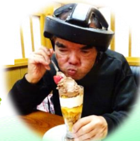
風呂上がり は念願のパ フェ 今日1日の 一番の楽し みでした。