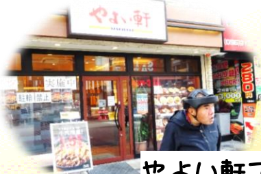
やよい軒でかしーのはずが、 なぜかからあげ定食に