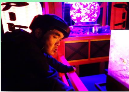
「なんてきれいなんだ～」