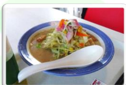
お昼は、リンガーハットの 野菜たっぷりちゃんぽん