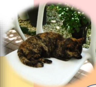
アーケードのイス で眠るネコ