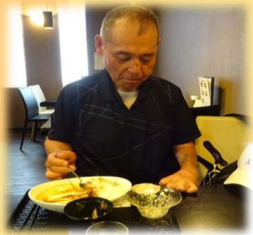
おしゃれな店でランチ のカレーを注文