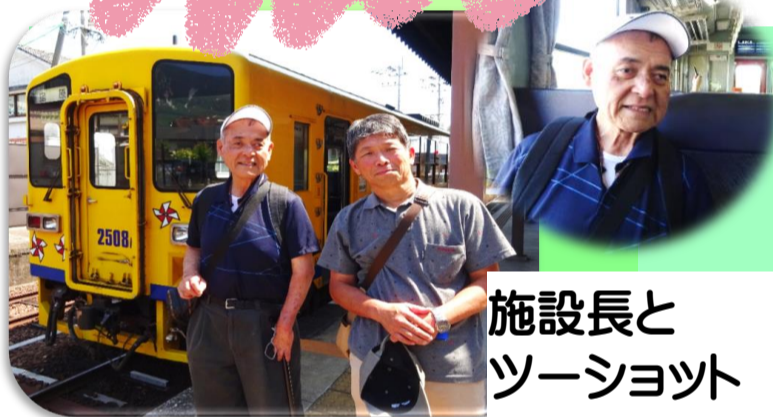
施設長と ツーショット