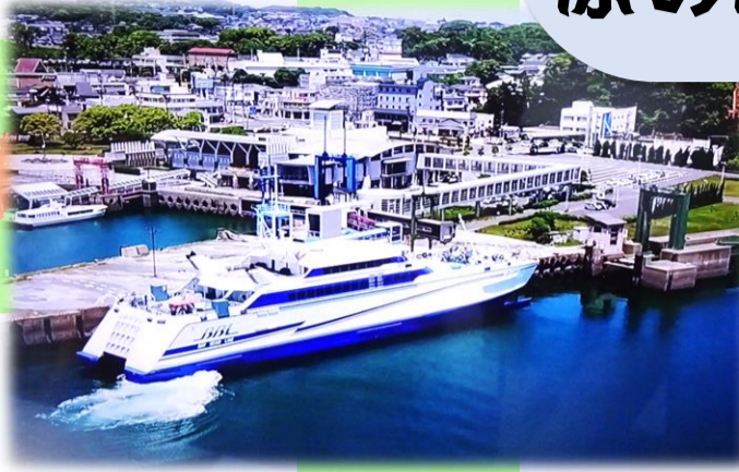
いい天気で、海も穏やか