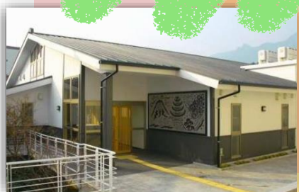
アーケード内のゆとろぎの湯