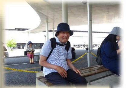
新しくなった熊本駅