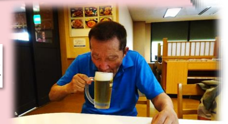
温泉の後に飲むビールはうまい！！