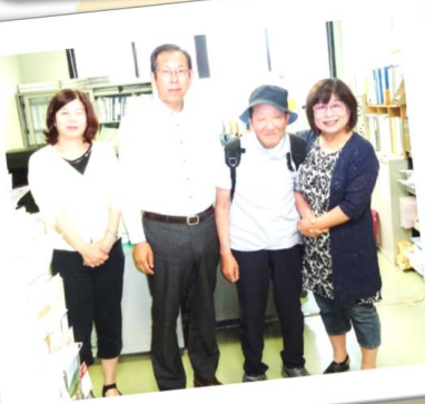
事務局に車を置いて、ごあいさつ