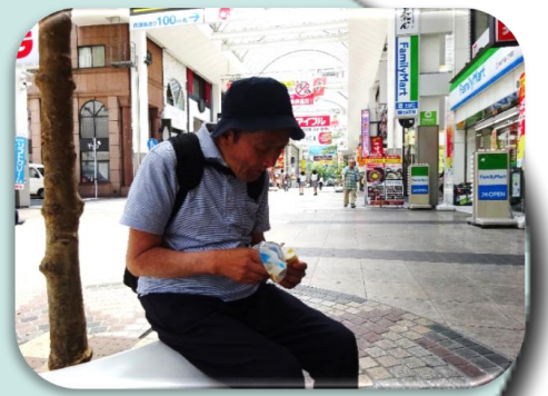
口直しは、ファミマのアイスモナカ