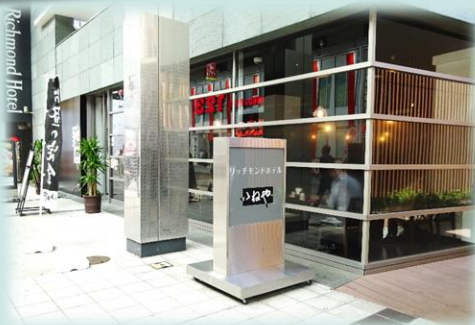
値段の割に豪華でおいしかった。