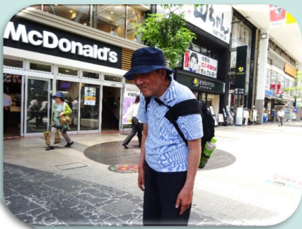
マックの店の前で