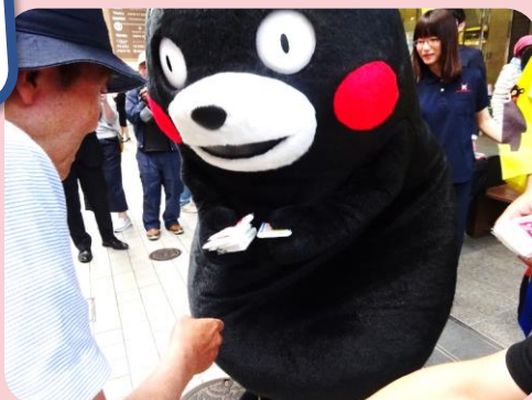
なんと、本物のくまモン登場。握手して、ティッシュをもらいました。