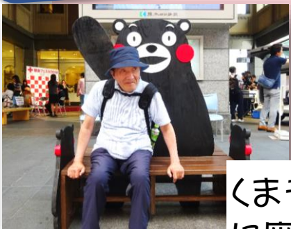
くまモンのベンチに座っていたら……